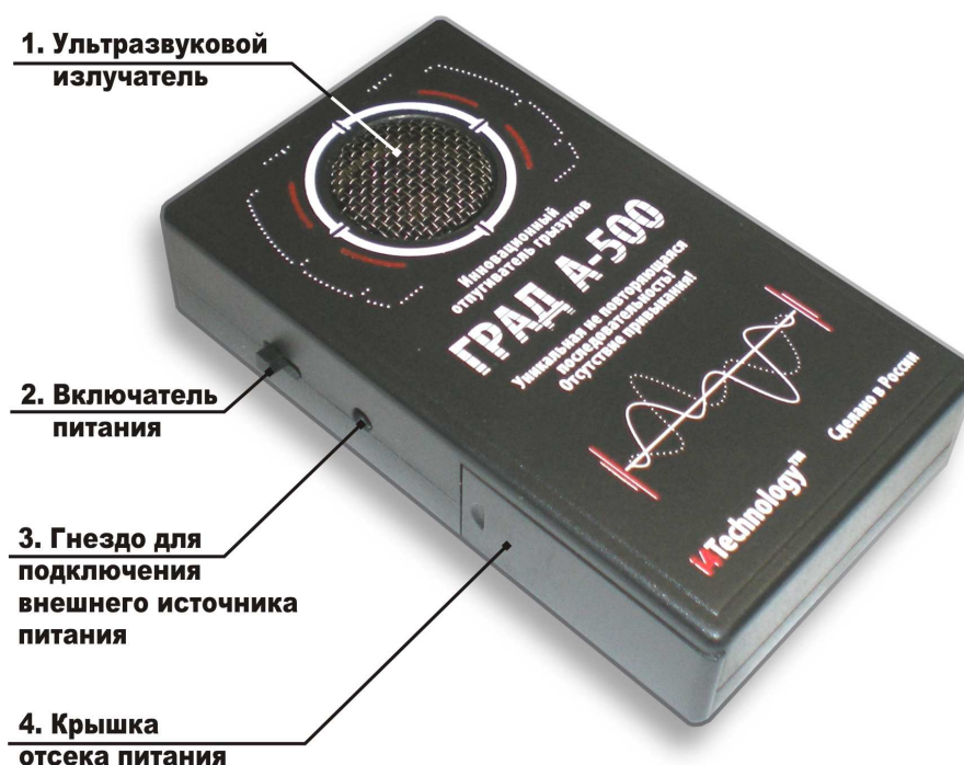
Рисунок 2 – расположение основных частей изделия

1.3.2 Расположение основных частей изделия представлено на рисунке 2.